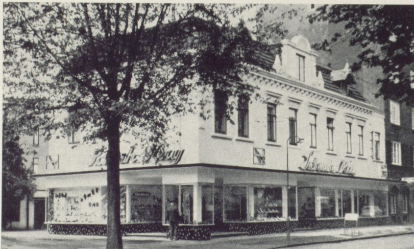
Langenfelder Damm 103