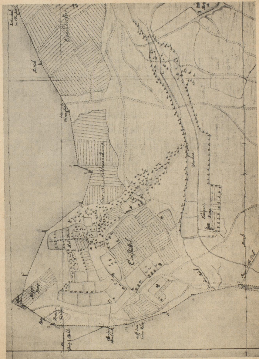
Karte 2 Ausschnitt aus der Karte von 1734 im Atlas Hamburgensis der Commerz-Bibliothek