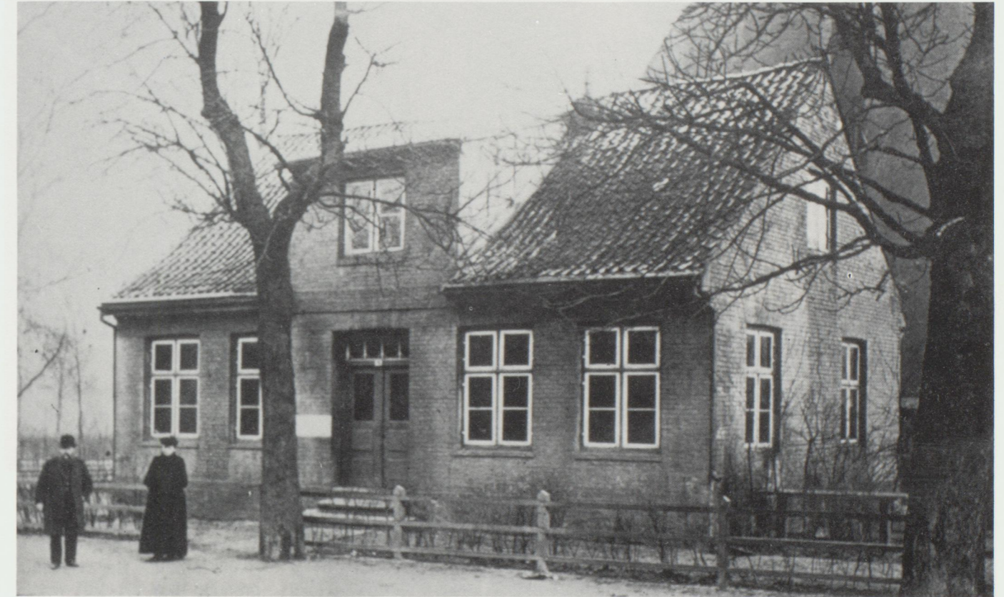
Die Schule am Schulweg

Reiche Hamburger Familien bauten sich schon im 18. Jahrhundert Landhäuser vor der Stadt. Sie legten in dem an