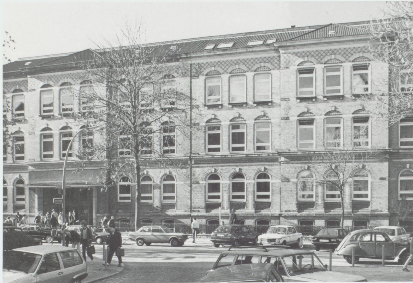
Das Schulgebäude in der Schwenckestraße